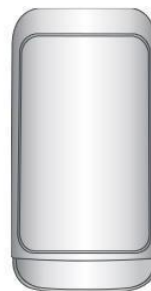
Apparato da esterno

Sarà il tecnico incaricato dell'attivazione ad occuparsi della configurazione.